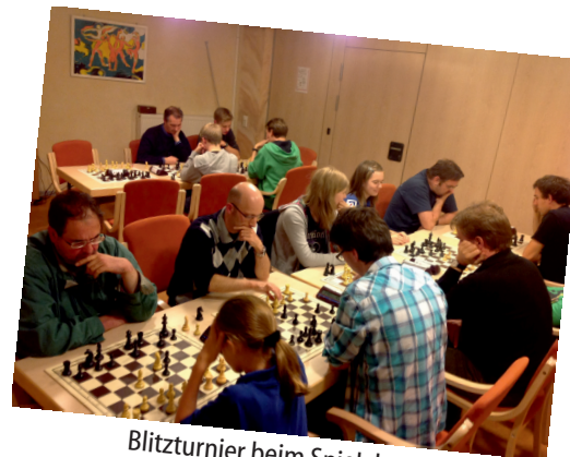
Blitzturnier beim Spielabend