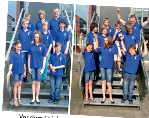
Vor dem Spiel