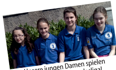
Unsere jungen Damen spielen in der 2. Frauenbundesliga!